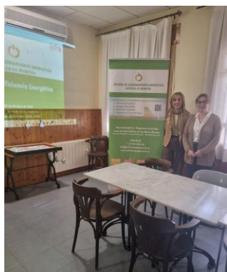
Charla en Arenas de San Juan