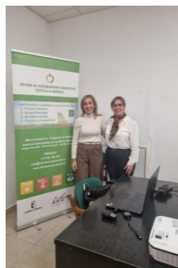
Charla en Villarta de San Juan